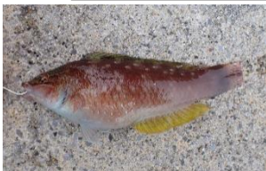
ホシササノハベラ