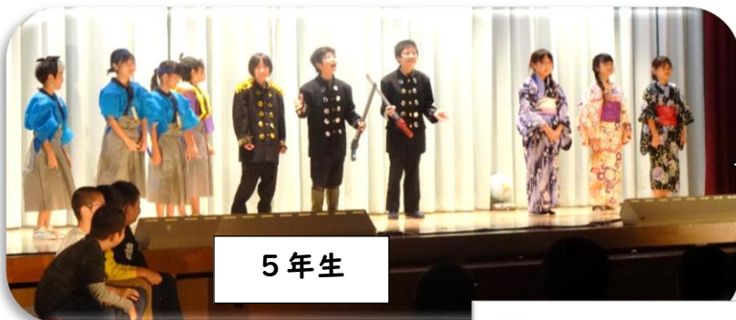
5 年 生