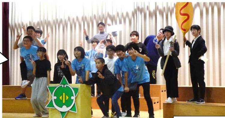
6 年 生

片付けにも保護者の皆様の御協力 をいただきました。御陰様で短時間 で終わることができました。ありが うございました！