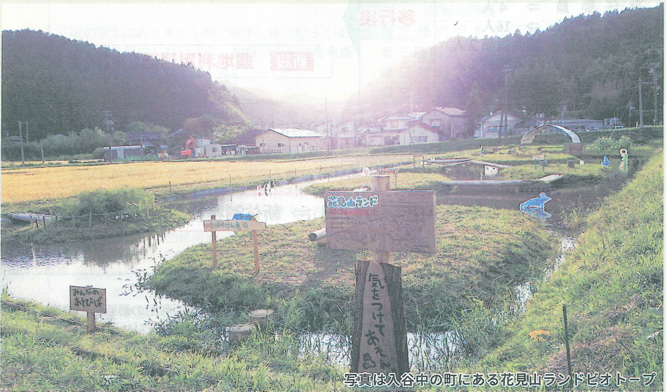
写真は入谷中の町にある花見山ランドビオトープ