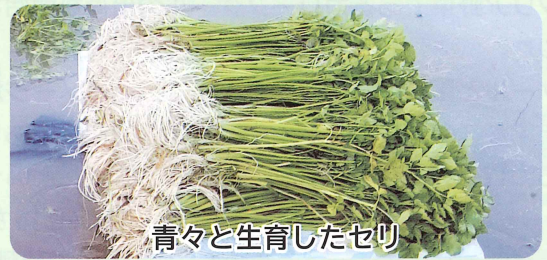
青々と生育したセリ