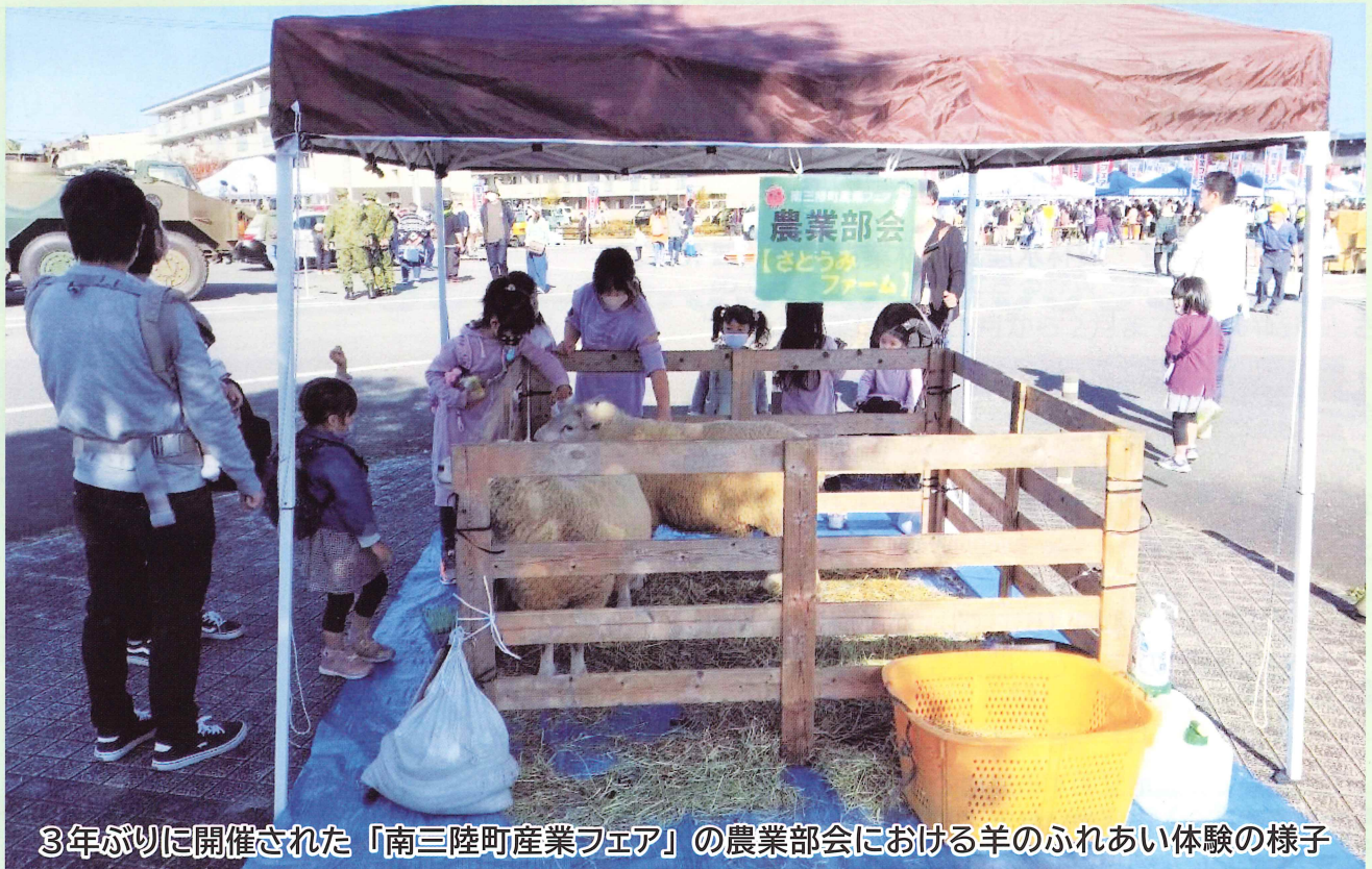
3年ぶりに開催された「南三陸町産業フェア」の農業部会における羊のふれあい体験の様子