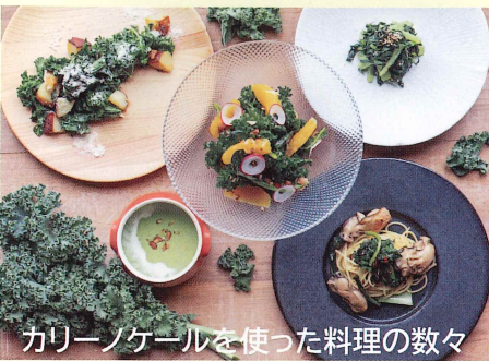
カリノケールを使った料理の数々

ケールと言えば青汁の原料として苦いイメージがありますがこのカリノケールはケールの仲間でありながら、「甘みが強く・苦みがほとんどない」といった