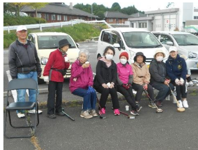
休憩中の和やかなひと時