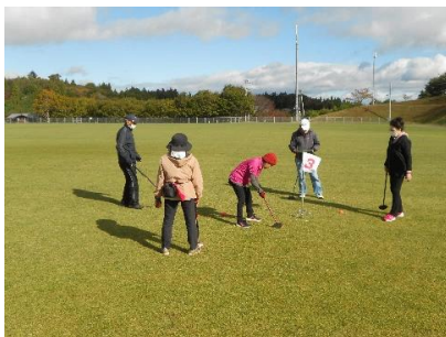
プレイ中は皆さん真剣！

参加された皆さま、運営にご協力いただいた方々には心より感謝申し上げます。ありがとうございました！次回も多くの方に楽しんでいただけるよう準備を進めてまいります。ぜひ、次の大会にもご参加ください。