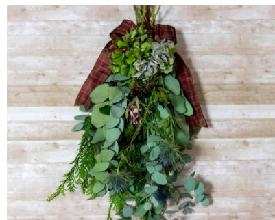
クリスマス・スワッグ （イメージ）