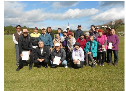
皆さんでハイチーズ