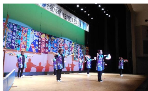
泊浜婦人会さんによる郷土芸能「泊浜ドヤ節」