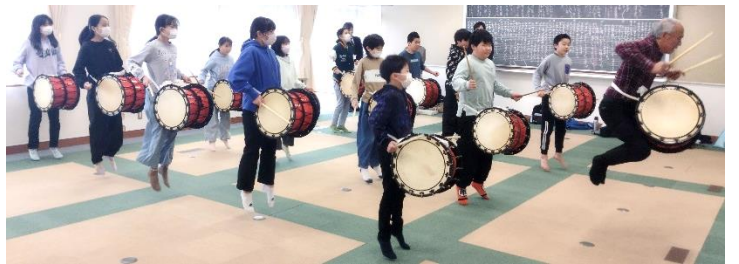
練習成果を披露する様子