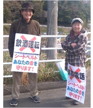
街頭指導の皆さん【左：沖田地区、中央：小細谷地区、右：藤浜地区】