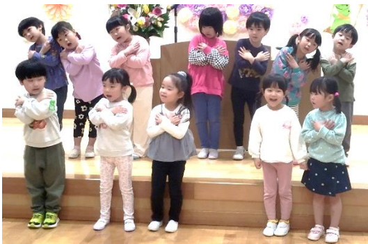
お祝いの歌を合唱するライオン組の皆さん