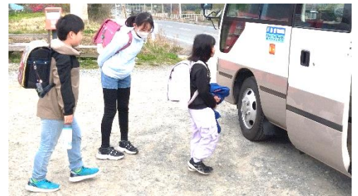
通学バス乗車の様子【波伝谷地区】