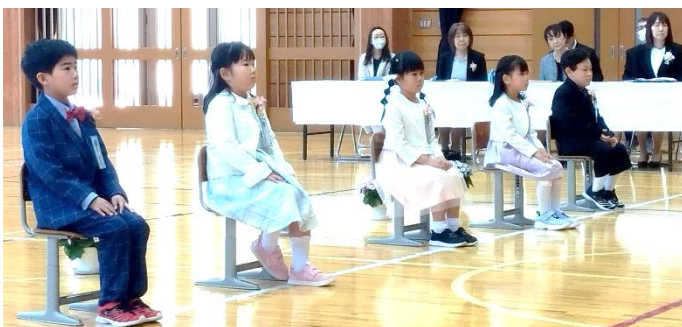
きちんとした姿勢であいさつを聞く新入生の皆さん