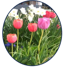
綺麗に咲いた 玄関前花壇の花

主な記事 戸倉保育所「入所式」、戸倉小学校「入学式」、春の交通安全街頭指導、戸倉婦人会【報告】、戸倉地区クリーン作戦、水戸辺鹿子躍学習会「委嘱状交付式」、神割崎「潮騒まつり」、花の植栽事業、戸倉コミュニティ推進協議会【報告】など