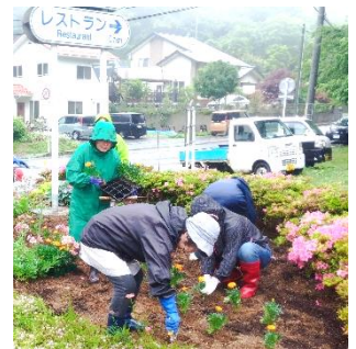
昨年の花植えの様子【左：沖田地区、右：寺浜地区】