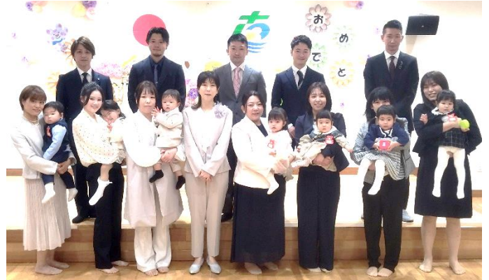
入所式での集合写真