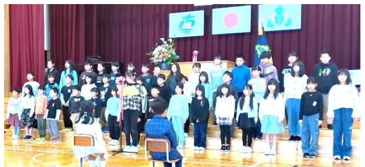
「歓迎のことば」と「歌」を披露する上級生の皆さん