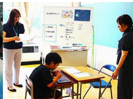
たいよう学級自立活動