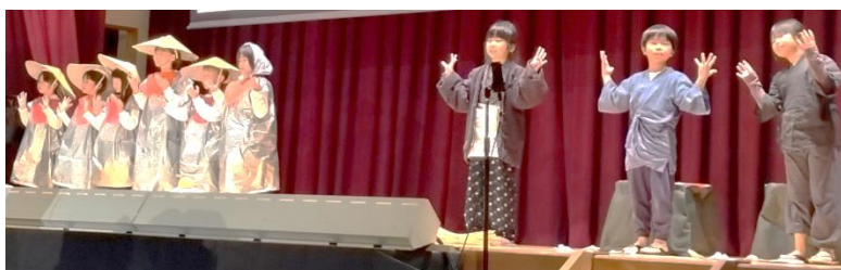
2年生「音楽劇：かさこじぞう」的一幕