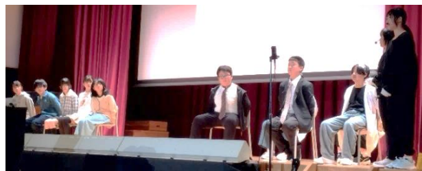
6年生「劇：未来は君とともに」的一幕