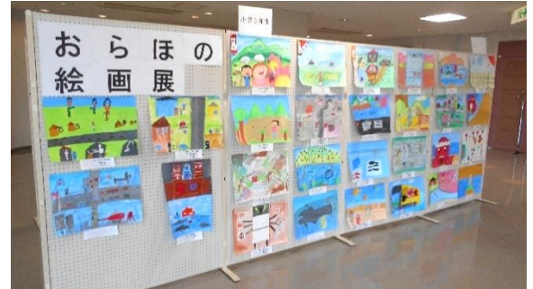
前年度の作品展の様子