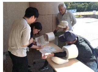
健康チェックとinBody測定