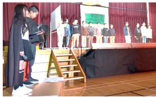
5年生「劇：ドキドキ脱出ゲーム」的一幕