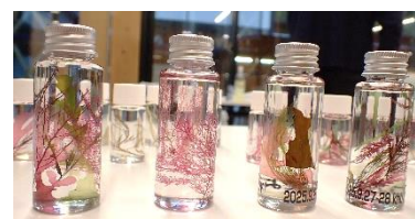
海藻ハーバリウム作品

当日は家族連れで延べ70人程の方が参加し、自然環境活用センター職員の分かりやすい説明のもと、手順に沿って作り方を学びました。海藻を自分の好きな形に切った後、丸い小さなビンの中にピンセットでつまんで入れる時は、手を震わせながら慎重に入れていました。その後、自分好みに出来上がったハーバリウムを横からみて、笑顔で満足そうな顔をしていたのがとても印象的でした。