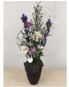
フラワーアレンジ教室 『10月作品』

発行 令和7年11月1日 戸倉公民館 (☎46-9920) 場所 南三陸町戸倉字沖田69番地2 【戸倉公民館だより第116号】