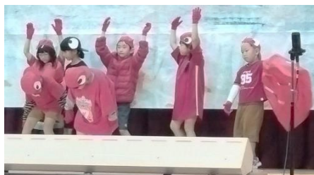
1年生「劇：ぼくたちのうみのスイミー」的一幕

当日は地域の皆さんが大勢観ている中、学習発表会のスローガン「心をつなぐ57人をつなぐ笑顔のステージ」のとおり、司会や照明係も子ども達で行い、元気いっぱいの演技と感動を地域の皆さんに届けていました。