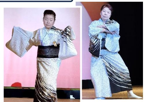
戸倉地区出身の二人による「藤扇流基裕会」の華麗な舞い

戸倉地区からも多くの演者さんが出演し、大勢の皆さんが駆け付け、多大なご声援をくださいましたことに対し、深くお礼申し上げます。