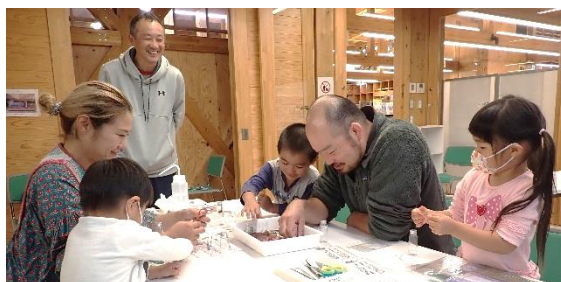
ハーバリウム作り体験の様子