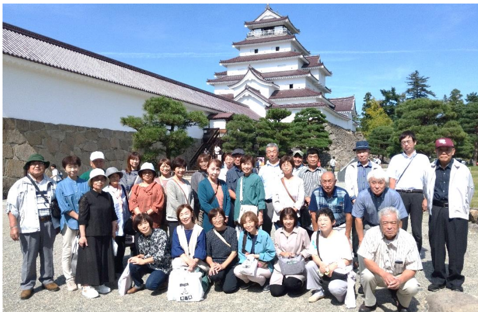
秋晴れの鶴ヶ城を背景にした集合写真