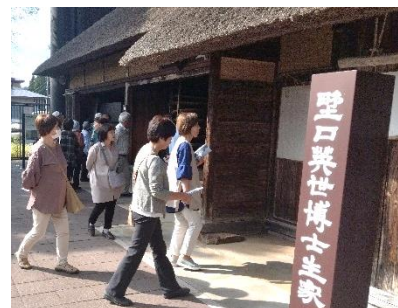
野口英世の生家見学の様子(上下)