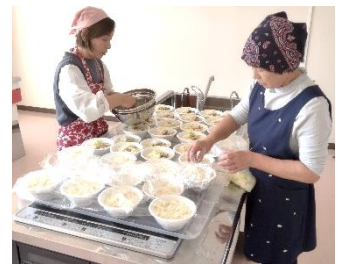
美味しいそうめん準備中