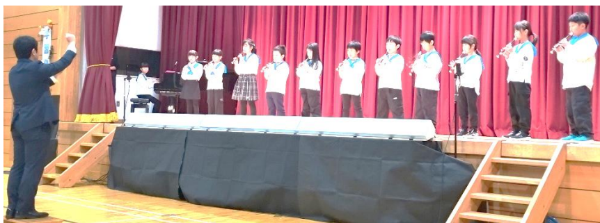
3・4年生「合奏・合唱：うしおっ子さわやか音楽会」