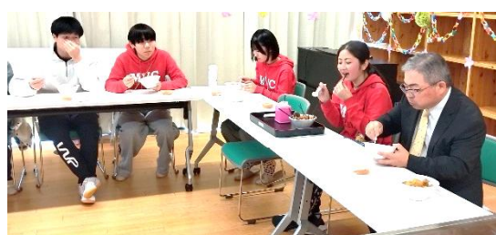
恒例の手作りカレーの昼食