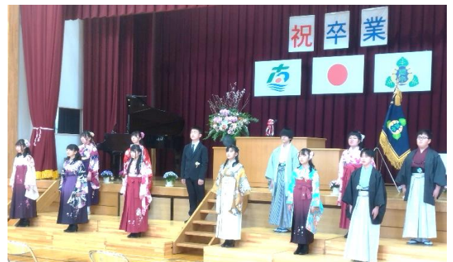
卒業生の「旅立ちのことば」の様子