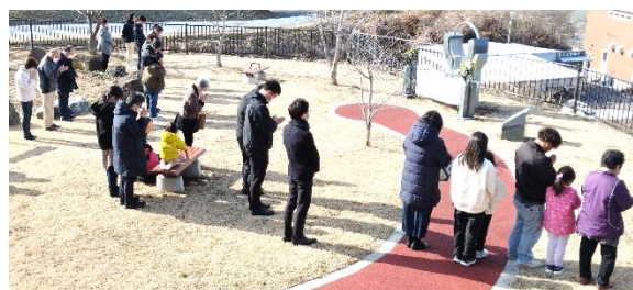
戸倉「追悼の丘」にて黙禱を捧げる皆さん

3月11日【火】、戸倉公民館脇の「追悼の丘」にも多くの方が足をお運びになられ、東日本大震災でお亡くなりになられた方々への追悼の意を表し、心からご冥福をお祈りするため、黙禱が捧げられました。