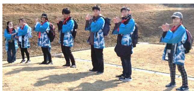
家々で笛を奏でる子ども達