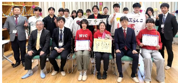
集合写真【賞状を持つのが今回の卒業生】

3月8日（日）、生涯学習センターで、いつも子ども会の行事でサポートしてくれている町の中学生・高校生たちのボランティアサークル「ぶらんこ」の卒業式が行われ、今年度卒業するリーダー【今年は1名】に対し、現役ジュニアリーダーたちが企画したゲームやダンスなどで盛大に送別しました。