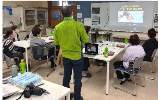
講義を真剣に聴き入る様子