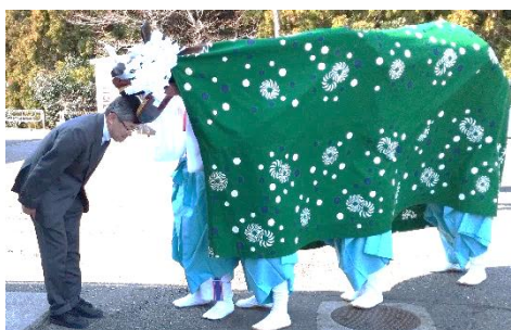
邪気を払うとされる獅子の頭噛みの様子