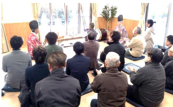
「お日待ちの神事」の様子