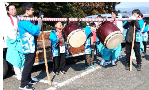
元気に太鼓を叩く子ども達

当日は、早朝6時から波伝谷集会所において「お日待ちの神事」が、午前8時には戸倉神社において「獅子舞の神事」が執り行われ、その後、東の村境から西の村境まで獅子が家々を回り、家主が用意した豆腐をくわえ、それを依り代として悪気を取り込み、厄を払いました。