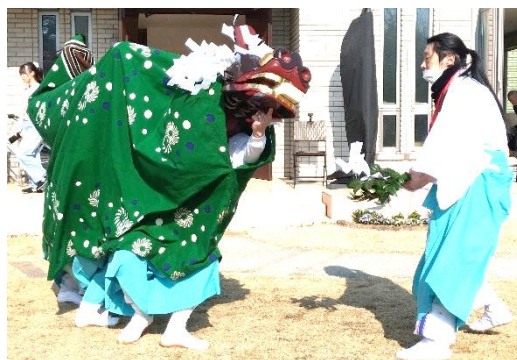
家の前で豆腐をくわえて舞う獅子