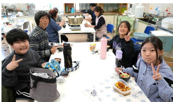
戸倉漁協女性部特製のとん汁で美味しい昼食