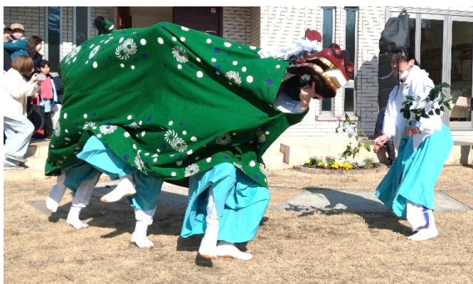
昨年の獅子舞の様子

主な巡行経路（個人宅除く）は、【戸倉神社→東境→自然の家→ビジターセンター→波伝谷団地→松崎団地→魔王神社→西境→波伝谷漁港→戸倉神社】となっております。