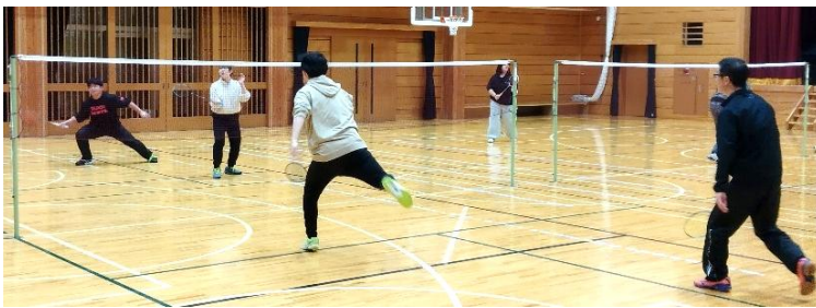
競技の様子【ダブルスの部】