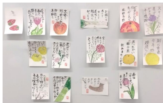
当日出来上がった講師と参加者の作品