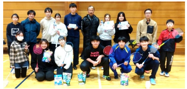
参加した皆さんで集合写真