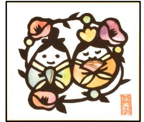
公民館展示作品 切り絵「お雛様」

主な記事 おきなぐらミニ作品展、絵手紙体験教室、波伝谷の春祈禱、ひな段飾り展示、戸倉地区親子なかよしくッキング、戸倉コミュニティバドミントン交流会、少年少女自然調査隊「海苔づくり体験」、カルチャーin 公民館講師募集ほか