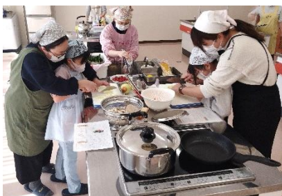
親子で仲良く調理している様子

2月21日（土）、戸倉公民館において保健福祉課と学校給食センターの栄養士が講師となり、「戸倉地区親子なかよしクッキング」が行われ、4組の親子と給食の栄養などについて学んだ後、調理実習では【タコと小松菜のスパゲティ・りっちゃんサラダ・りんごゼリー】を作って美味しく食べました。