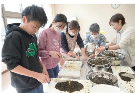
行程②「海苔仕分け・洗い」