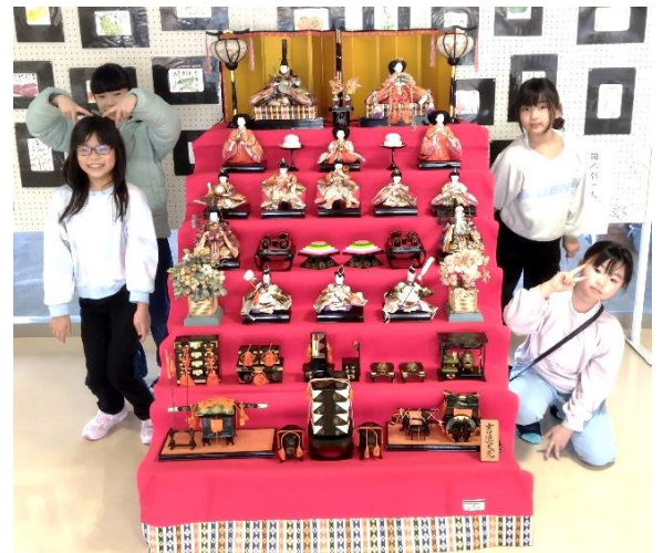
親子なかよしクッキングに参加した子ども達と一緒に