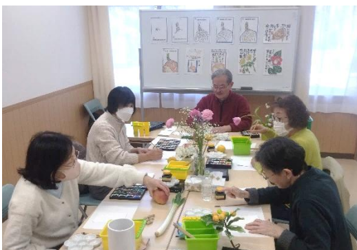
ゆっくりとした時間が流れる絵手紙教室の様子

令和8年度もカルチャーin 公民館で「絵手紙」は行われますので、興味のある方・参加してみたい方は、戸倉公民館までお問い合わせください。【募集案内は4月を予定しております。】