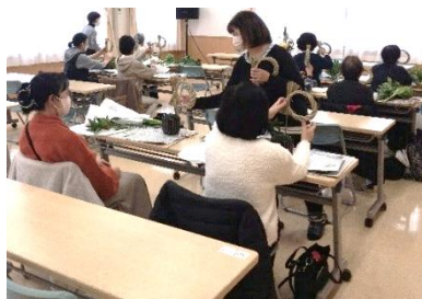
花を生けている様子