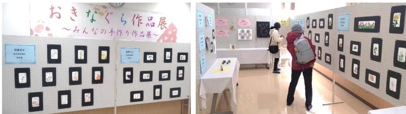
昨年の展示会の様子