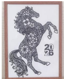
公民館展示作品 切り絵「午(うま)」

発行 令和8年2月1日 戸倉公民館 (☎46-9920) 場所 南三陸町戸倉字沖田69番地2【戸倉公民館だより第119号】