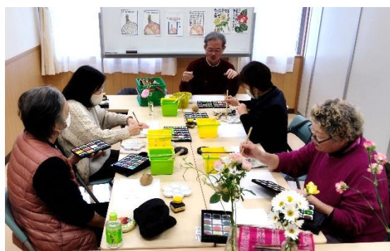
昨年の「絵手紙体験」教室の様子