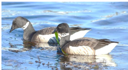
アマモを食べるコクガン

自然環境活用センター（☎25-9703）やビジターセンター（☎25-7622）で双眼鏡を貸し出していますので、時間に余裕があるとき、ご家族で愛らしいコクガンを観察しに行ってみてはいかがでしょうか。