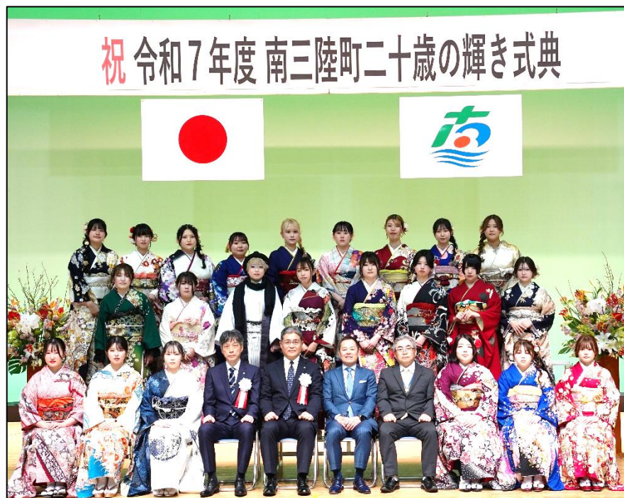
志津川中学校を卒業した女子の皆さん