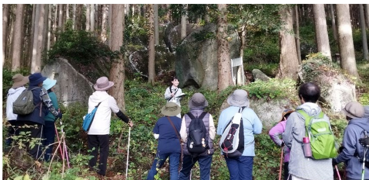
「神行堂山の巨石」の説明の様子