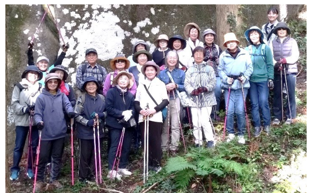
「神行堂山の巨石」前での集合写真