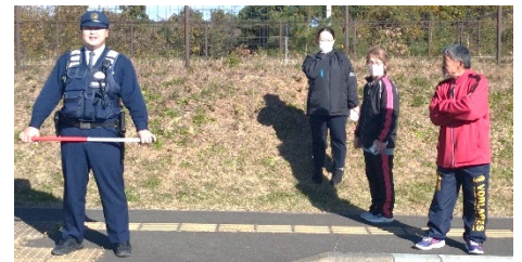
見守り協力と応援の皆さん(上・下)