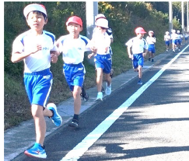
沿道を走る児童の皆さん①