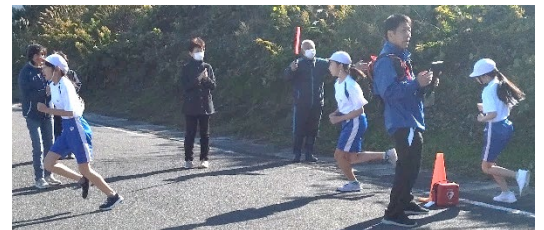
沿道を走る児童の皆さん②