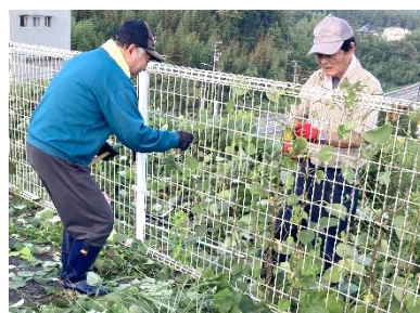
金網のつる草取り