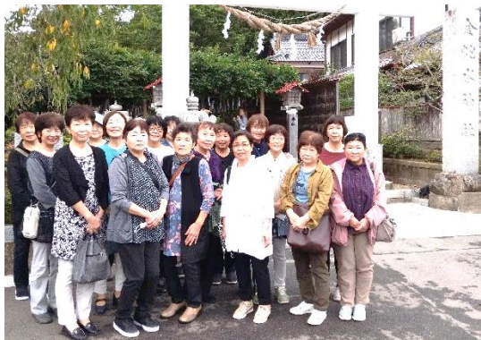
金蛇水神社(岩沼市)での集合写真

9月20日（土）、戸倉婦人会による施設巡りが行われ、17人が参加しました。当日は、岩沼市の「金蛇水神社」や亶理町の「鳥の海ふれあい市場」、仙台市の「せんだい農業園芸センター」などを見学し、「金蛇水神社」では参拝者に金運をもたらすとされる蛇の石像に財布をこすりつけ、それぞれに金運向上を願っていました。