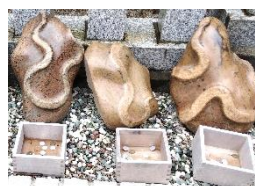
財運をもたらす蛇の石像