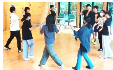
ダンス練習の様子

この対面式は、ジュニア・リーダー【以下：JL】の初級研修会を修了し、「ぶらんこ」でのボランティア活動を希望した新人JLと現役JLが初めて顔を合わせ、現役JLからJLの基礎知識やダンスの練習等を教わり、子供たちとのレクリエーション活動などを行うまでのJLとしての第1歩となる事業です。