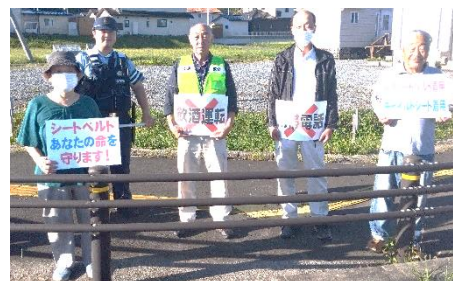
街頭指導の皆さん【左：宇津野地区、右：沖田地区】