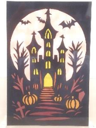
公民館展示作品 切り絵「ハロウィン」

主な記事 戸倉コミュニティ「グラウンド・ゴルフ大会」開催、戸倉地区環境美化清掃活動、秋の交通安全町民総ぐるみ運動、ジュニアリーダー対面式、「町民文化祭」開催、戸倉婦人会施設巡り、「町長杯グラウンド・ゴルフ大会」開催、神割崎「日の出」ほか