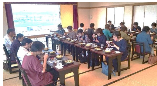
漁港が見える昼食会場での食事(亶理町)