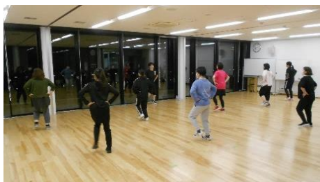
フィットネス教室 （第2・4水曜日）