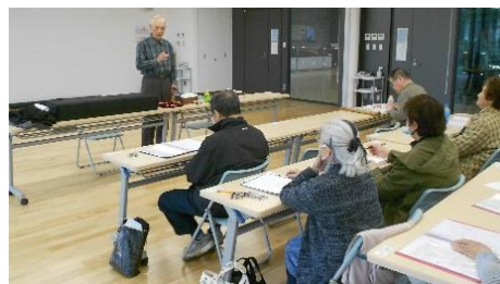
民謡教室 （第2土曜日）