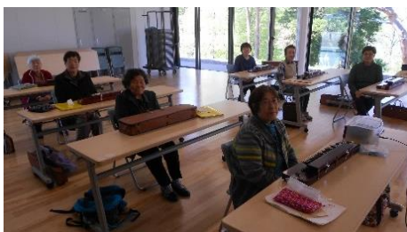
大正琴教室 （第2・4木曜日）