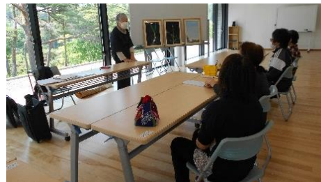
三原色画教室 （第3火曜日）