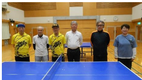
ラージボール卓球教室 （第1・2火曜日）

なお、開催日は変更となる場合がありますので「歌津地区の各種行事予定」をご覧ください。公民館までお問い合わせください。