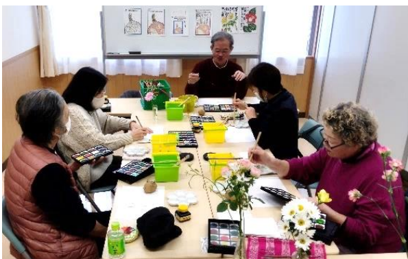
ゆっくりした時間が流れる絵手紙教室の様子

令和7年度もカルチャーin 公民館で「絵手紙」は行われますので、興味のある方・参加してみたい方は、戸倉公民館までお問い合わせください。【募集案内は4月に行います。】