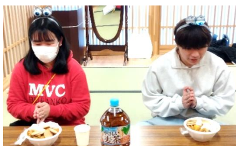
卒業生2人【恒例の食事会】