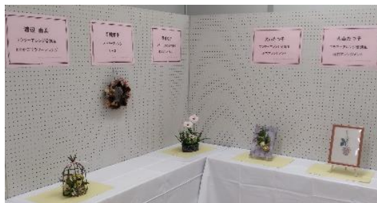
「フラワーアレンジ」作品