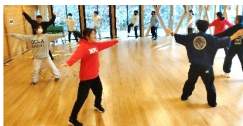
全員でスタンツ（ダンス）