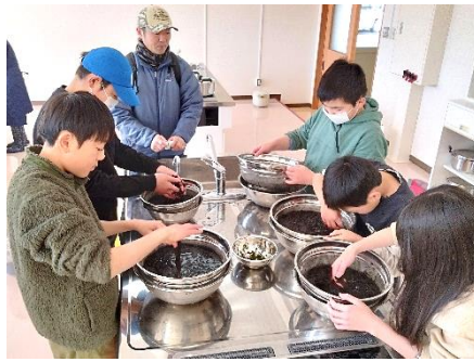
行程②「海苔仕分け・洗い」