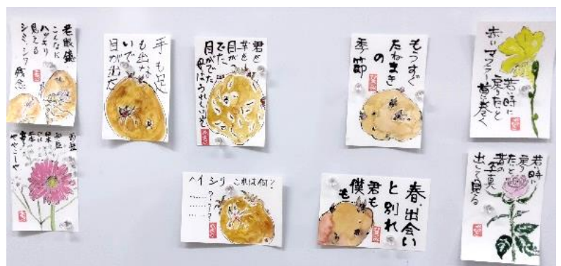
当日描いた講師及び参加者の作品