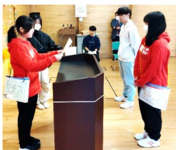
現役会長から卒業証書授与