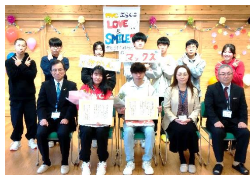
記念撮影（教育委員会の皆さんと）

地域の子どもたちのお兄さん・お姉さんの存在で各種子供会行事でサポートしていただき、公民館としても深く感謝申し上げます。