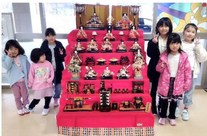
遊びに来た地域の子どもたちと一緒に