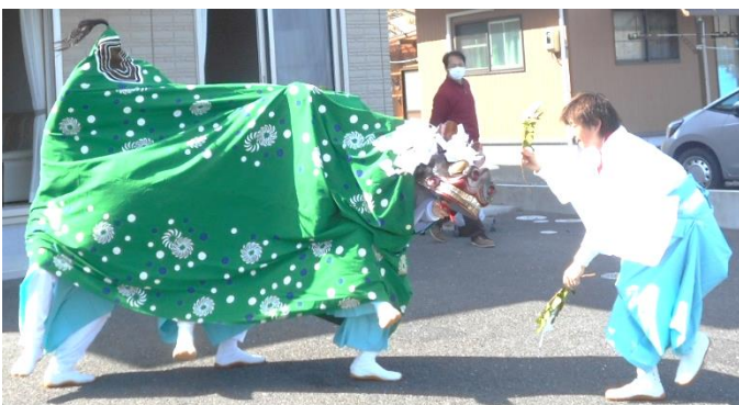
昨年の獅子舞の様子