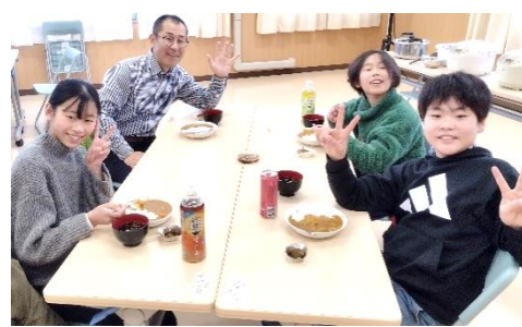
おいしいカレーで笑顔の昼食