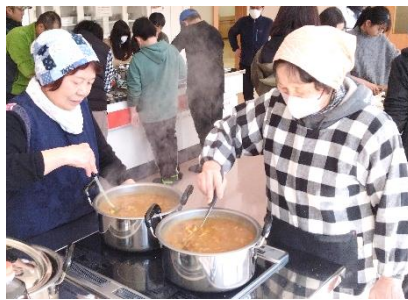
戸倉漁協女性部のカレー作り