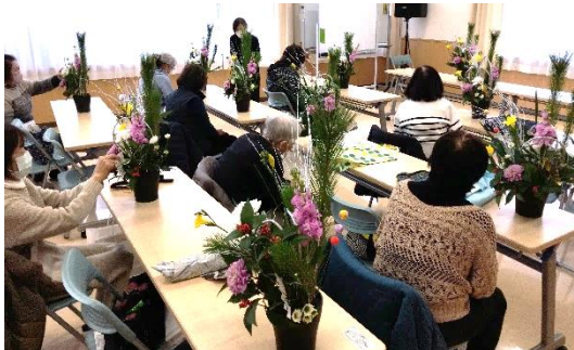
花を生けている様子

当日は、長い枝を丸くして輪を作るのに四苦八苦（しくはっく）して、「う～ん、曲がらないわ。」「あら、折れちゃったわ。」などと参加者同士で会話しながら楽しく花を生け、ようやくきれいに飾りつけが済んだ参加者は、お互いに作品を觀賞し合い、「これで安心して正月が迎えられるわ。」と満面の笑みで喜んでいました。