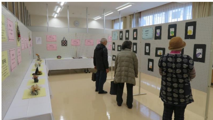
昨年の展示会の様子【左：絵手紙、右：パッチワーク、プリザードフラワー】