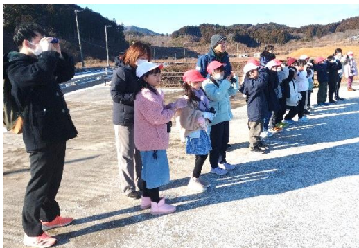
双眼鏡、望遠鏡などを使って観察している戸倉小学校児童