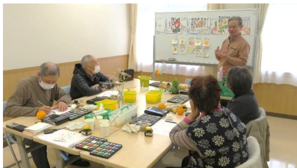
昨年の教室の様子