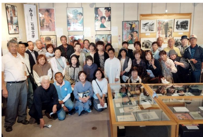
石坂洋次郎文学記念館