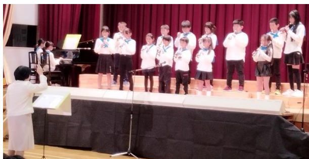
合唱「うしおっ子 そよ風音楽会」の様子

当日は、地域の皆さんが大勢観ている中、児童全員が『歌って・踊って・演じて』、学習発表会のスローガン「笑顔輝くステージ 届けよう感動を」の言葉どおり、明るい笑顔と感動を届けていました。