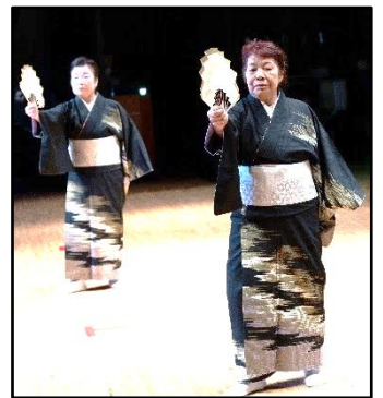
戸倉地区出身の二人による「藤扇流基裕会」の華やかな舞い

戸倉地区からも多くの演者さんが出演し、また、大勢の皆さんが来場しご声援くださいましたことに対し、深くお礼申し上げます。