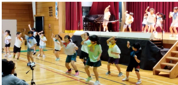
ダンス「うしおっ子 オン ステージ」の様子