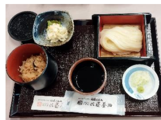
秋田名物「稲庭うどん」