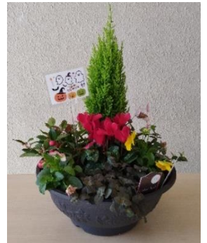
完成した寄せ植え鉢