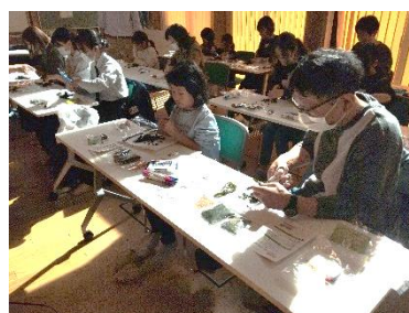
ふりかけ作りの様子