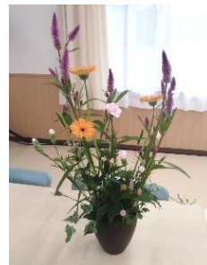
カルチャーin 公民館 「フラワーアレンジ」10月作品

発行 令和6年11月1日 戸倉公民館（☎46-9920） 場所 南三陸町戸倉字沖田69番地2 【戸倉公民館だより第104号】