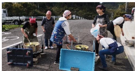
健康づくり隊の豚汁協力