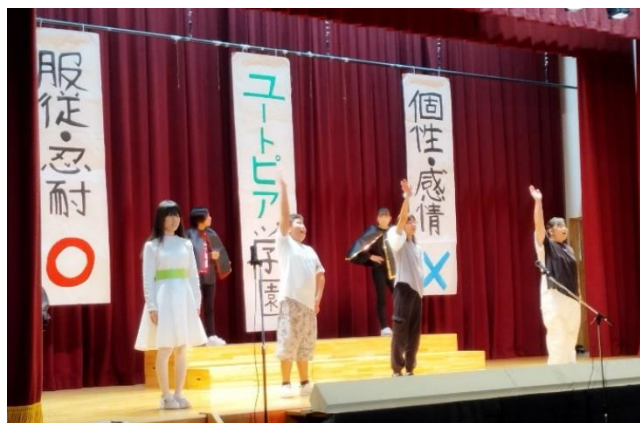
劇「エルコスの祈り」の一幕