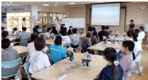
南三陸の自然について学習中

最初、ホタテを初めて剥く人が大半で貝を開くのに難儀していましたが、切り取った細胞を顕微鏡で観察する作業に移ると、生きた細胞の動きに目を輝かせ、興味津々に顕微鏡を覗いていました。