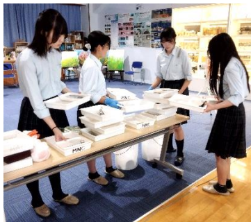
南三陸高等学校の生徒会の皆さん