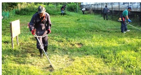
地域の草刈精鋭部隊の皆さん