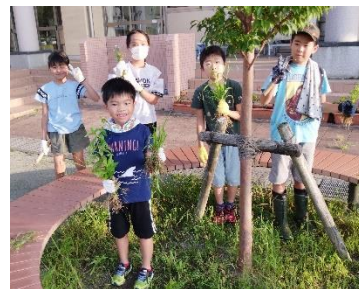
みんなで楽しく草取り中