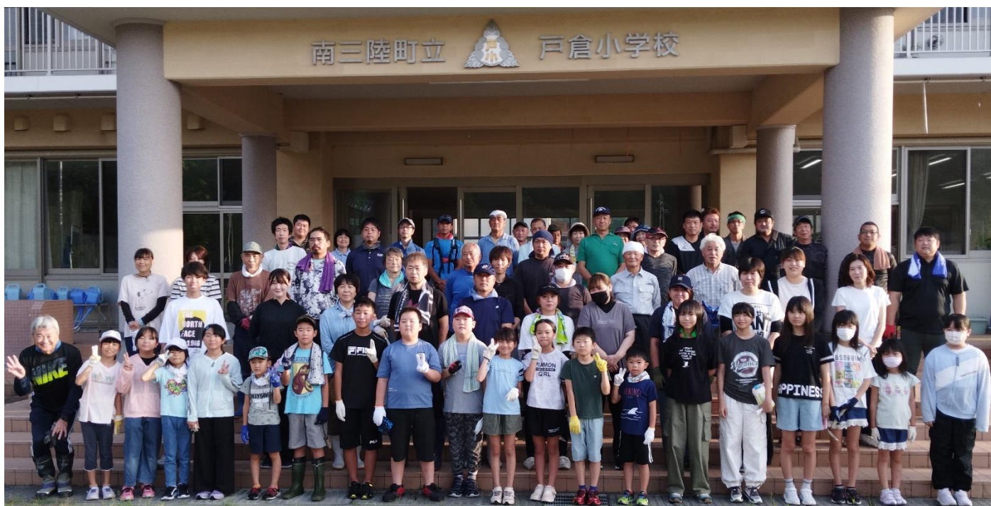
参加者全員での集合写真