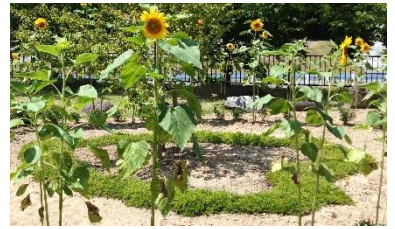
見事に咲いた追悼の丘のひまわり

発行 令和6年9月1日 戸倉公民館（☎46-9920） 場所 南三陸町戸倉字沖田69番地2 【戸倉公民館だより第102号】