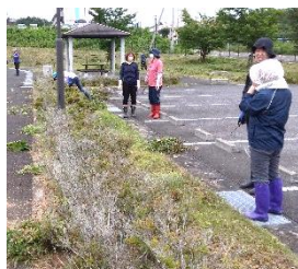
公園内の草刈の様子及び植木手入れ後の談笑の様子