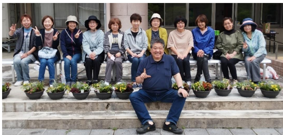
講師と参加者全員での記念写真