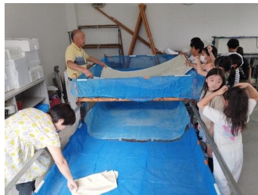
みんなで協力して飼育台を組み立てる様子

最初は教室で学習した後、校内の蚕の飼育場に移動して、みんなで飼育台を一から組み立てました。今後、年明けの2月の総合発表会まで、お蚕様を育て生態を学んでいきます。