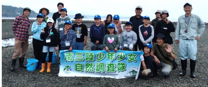
南三陸少年少女自然調査隊の皆さん