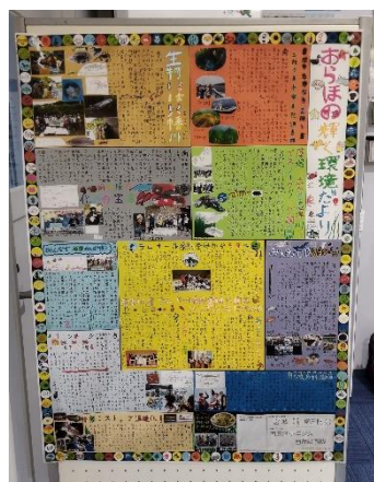
子ども達の活動レポート