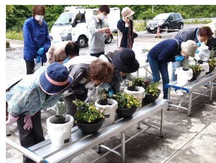
カレープラントの匂いを確かめる様子