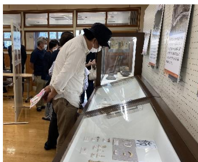
展示品観覧(報告会后)