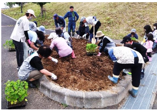
花の植栽の様子【左・下】