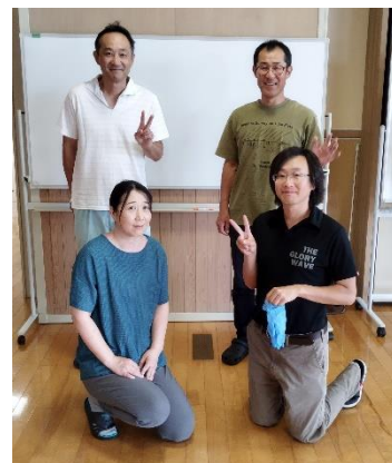
自然環境活用センターの皆さん

また、「南三陸少年少女自然調査隊（事務局：自然環境活用センター）」の子ども達は、月1回ほどのペースで海や川、田など各種のフィールド体験を行って、町の森・里・海・川・歴史などの素晴らしいさを1年間かけて学習し、活動レポートを作成し、地元の自然の良さを町内外に向けて発信しています。