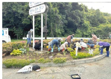
昨年度の寺浜地区の様子