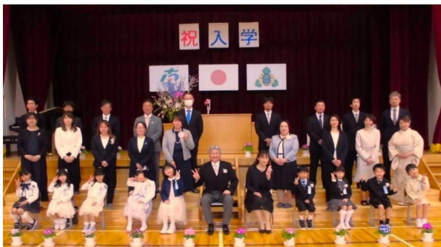
入学式の新入生及び保護者の集合写真

今後とも、子供たちの通学の見守りほか、地域の皆様によるご協力をお願い申し上げます。