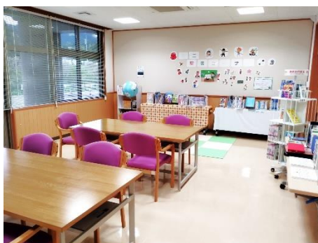
静かに読書や勉強ができます！