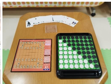
将棋・オセロ・トランプ