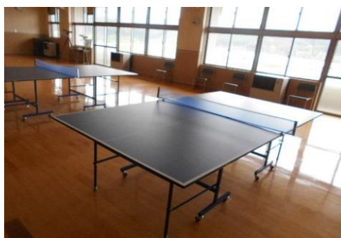
卓球(2台)やラダーゲッターゲームで遊べます！

紐のついたボールを棒に引っかけて点数を競うラダーゲッターもありますので、是非お試しください。