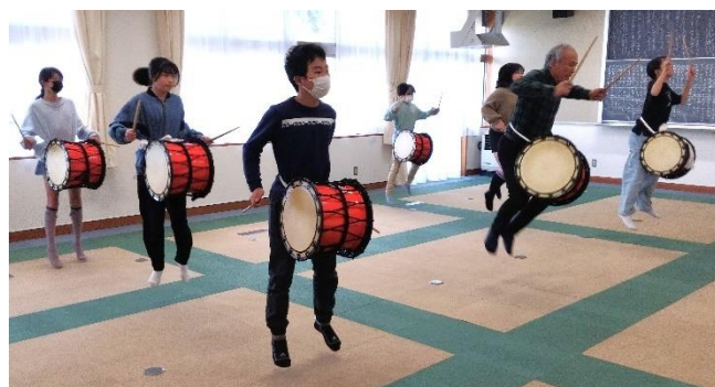
4月20日（土）の練習前の集合写真【左】と練習の様子【上】