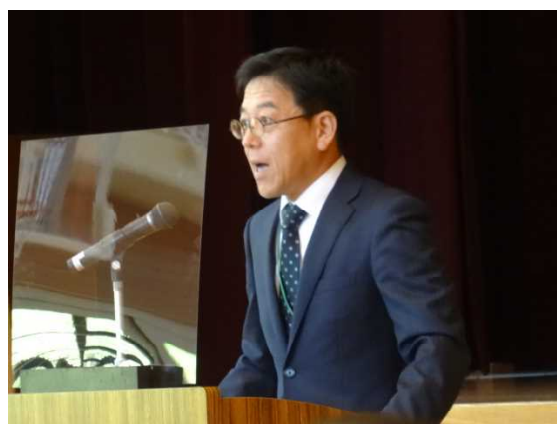
自作の飛沫感染防止シートの前でお話しする校長先生！

さて、始業式では、校長先生からこの2学期に2つのことを頑張ってもらいたいというお話がありました。1つは、「今、自分がしなければならないことは、その日のうちにしっかりと行うこと」、2つ目は、「これまで以上に友達を大切にしてほしいこと」です。この2つのことを目標として、頑張ってもらいたいと思います。また、本校職員も一丸となり、2学期も60人全員が充実した学校生活を送れるように励ましたり指導したりしてまいります。2学期も、よろしくお願いいたします。