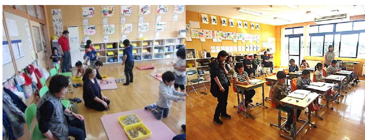
(1年生の授業の様子)

9月19日(木)に祖父母参観がありました。祖父母の皆さんに、普段の学習の様子を見ていただいたり、昔の遊び道具を一緒に作っていただいたり、地域の保存食について教えていただいたりしながら、楽しく学べた時間になりました。