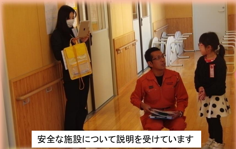
安全な施設について説明を受けています