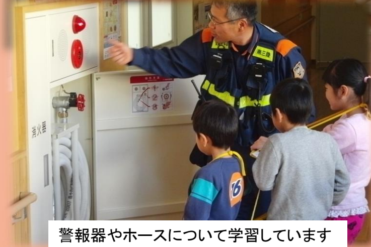
警報器やホースについて学習しています