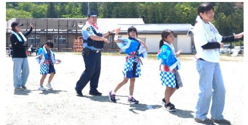
来場者も参加した「浜甚句」おどり