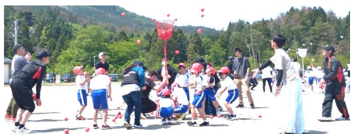
保護者も参加の玉入れ競争