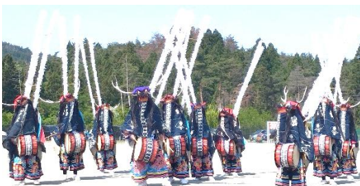
オープニングの「水戸辺鹿子躍」演舞