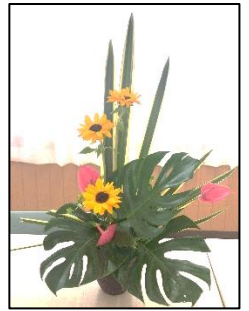
フラワーアレンジ教室 『5月作品』

発行 令和8年6月1日 戸倉公民館 (☎46-9920) 場所 南三陸町戸倉字沖田69番地2 【戸倉公民館だより第123号】