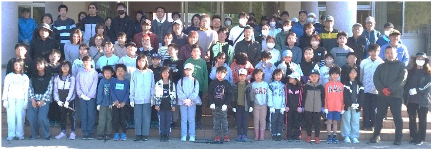
集合写真(校舎前にて)