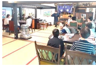
講話・散策の様子