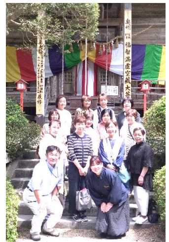
集合写真(本堂前にて)