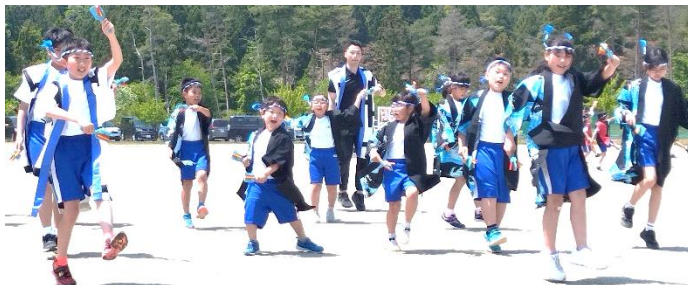
迫力ある「よさこい」演舞