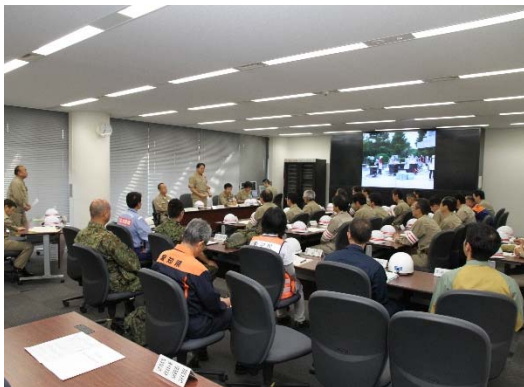
図：災害対策本部イメージ