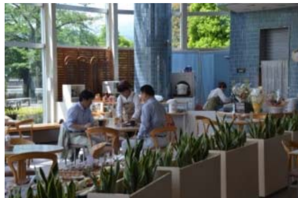
図：オープンカフェイメージ