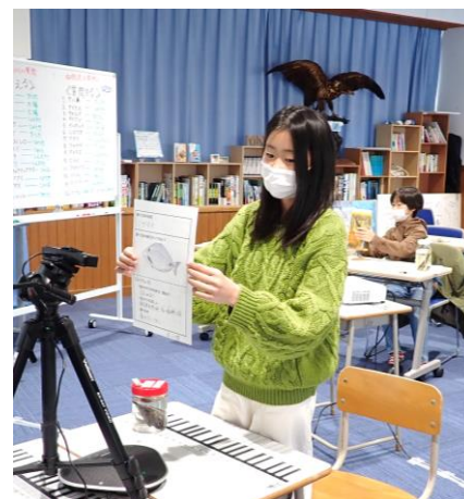
調査隊の発表の様子