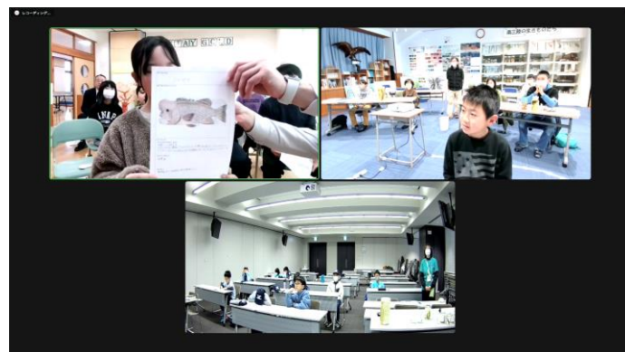
脇野沢小学校の発表の様子