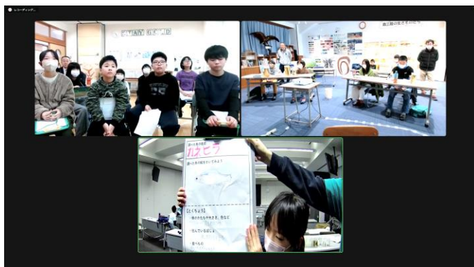
コウノトリ KIDS クラブの発表の様子