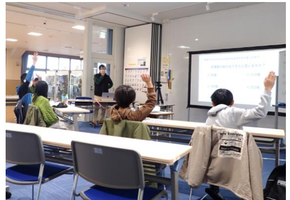
環境 DNA 調査結果と実際の標本を見比べ中!