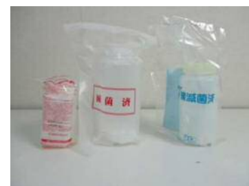
滅菌ビン 右より500ml(ハイポ入り)、 500ml(ハイポなし)、200ml