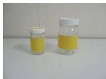
広口ガラスビン 右より450ml、150ml