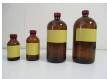
褐色ガラスビン 右より1ℓ、800ml、200ml、 100ml