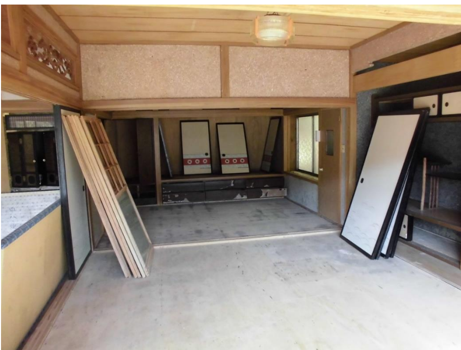
1階 和室 (奥)