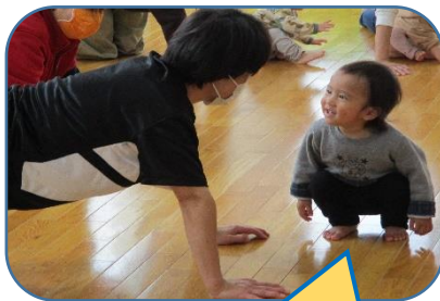
純子先生、体操楽しいね