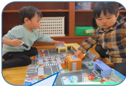
お友だちになったよ!!