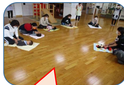
ベビーマッサージ習得中