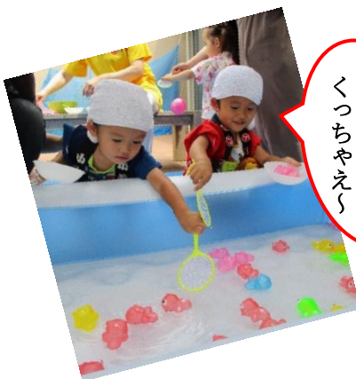
金魚、全部すくっちゃえ〜