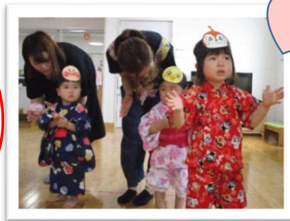
浴衣に甚平姿。みんなで盆踊り楽しかったね。