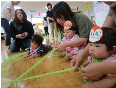
金魚すくいや魚釣り、お面に盆踊り等々。お祭り最高!