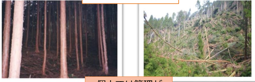
整備が遅れた森林