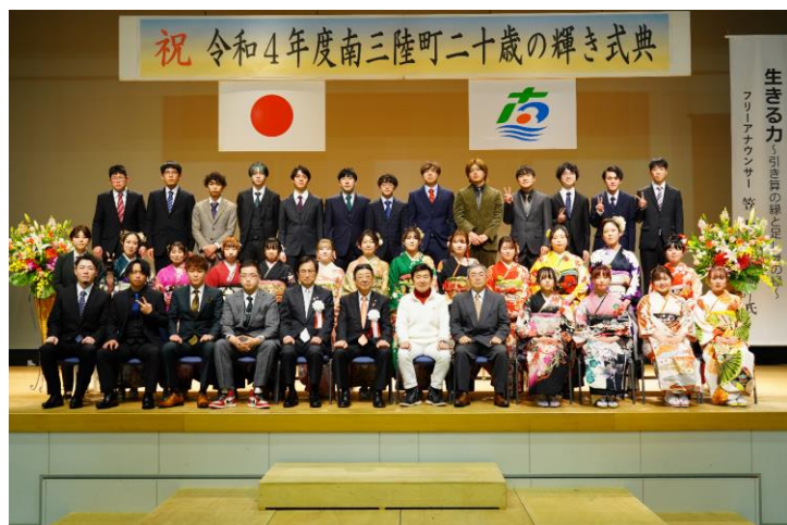
歌津地区の皆さんで集合写真

今後皆さまの人生がますます充実し、ステキな未来になることを願っております。改めまして20歳になられた皆さま、おめでとうございます！