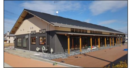
開設間近の「地域ささえあいモール」

いよいよ(仮称)地域ささえあいモールの開設が近づいてきました。そこで今回は、参加者のみなさんがモールを疑似体験し、つくり・備品等へのご意見や、モールでの活動イメージを話し合いました。