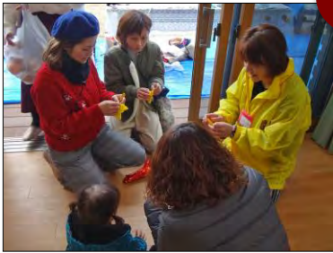
みんなで飾り付けの準備。 ちびっこもお手伝い。