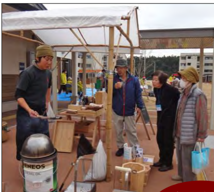
手作りストーブで焼いた ほっかほかの焼きいも。