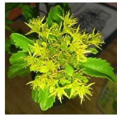
上がマルバマンネングサ 左が飾ってあるマンネングサ 下がスエコザサです

牧野博士が命名した植物は 1,500 種類を超えます。命名した有名な植物に宮城県仙台市で発見し妻の名前を付けた笹があります。