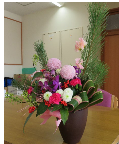
去年のお正月フラワーアレンジ