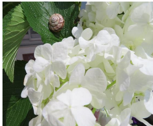
大手穂とかたつむり

気候の変化はありますが、体調管理に気をつけながら今月も過ごしていきましょう。6月は旧暦の和名で「水無月(みなづき)」とも言います。梅雨なのに水が無いというのも不思議ですが、この場合の「無」は無いという意味ではなく「の」という意味合いで使われているようです。「6月は水の月」なんですね！