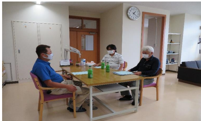
戸倉コミュニティ推進協議会幹部会