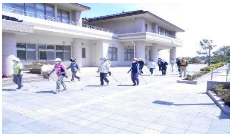
ノルディックの様子

ノルディックウォーキングは年齢を問わず、誰でもできるスポーツです。ちょっとした正しい歩き方を教えていただくと、正しい姿勢、基礎体力が身につく、筋力のアップにより腰痛予防やダイエット等、良いことがいっぱいあります。戸倉公民館ではカルチャー in 公民館として毎月第1、3木曜日に行っています。カルチャー教室で継続が難しい方、参加したいが皆さんについていけないか不安がある方、興味はあるもののなかなかきっかけがなく参加出来ずにいる方等を対象に、もっと地域の方々に知っていただくために、コロナ感染症が落ち着きましたら、初心者向けのノルディック体験教室のようなイベントを考えています。今しばらくお待ちいただき、安全に開催できるようになりましたらお知らせしますので、是非この機会を、元気になる取り組みを楽しみに・・・ご参加をお待ちしています。