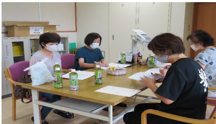
戸倉婦人会幹部会

1日も早く日常生活が戻るように、情報の変化に対応できるように努め、コロナ禍でも実施内容を検討し、安全にできる時期が来ましたら実施することで情報共有し、確認しましたので今後どうぞよろしくお願ひします。