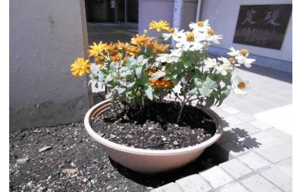
ジニアプロフェーション

まだ暑さが落ち着かないような気温ですが、皆さんいかがお過ごしでしょうか？戸倉公民館では玄関前の花壇を植え替えました。日々草とジニアプロフェーションという花を植え、玄関がまた華やかになりました。これからも、季節に応じて花壇の植え替えをしていきますので、おすすめのお花があれば是非教えてください。また、戸倉公民館にも是非お立ち寄りください。お待ちしております。