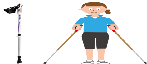
ノルディックのポール

戸倉公民館では、今年度の備品としてノルディックウォーキングポールを30名分準備しました。無料で貸出しをしておりますので、ポールがない方でも安心して参加いただけます。