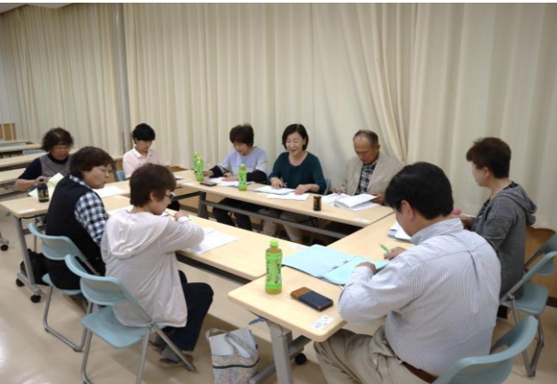
第2回おきなぐら納涼まつり実行委員会 (ステージ部会打合せの様子)