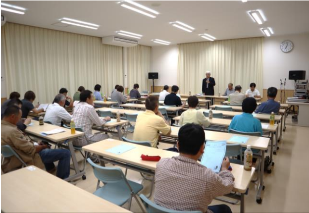
第1回おきなぐら納涼まつり実行委員会