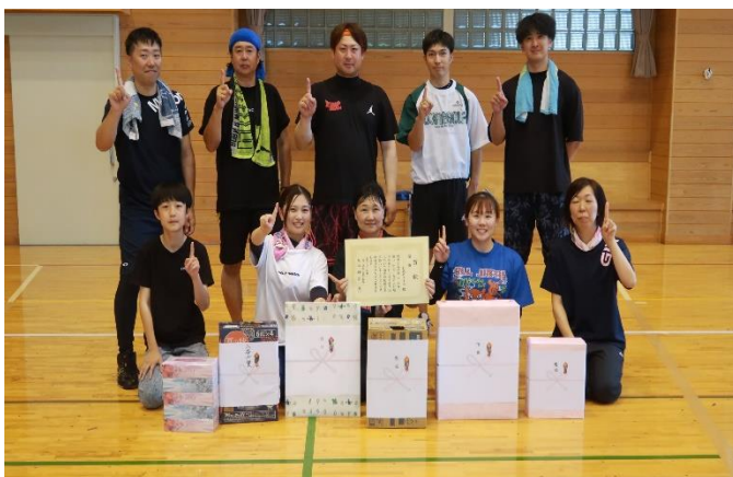
優勝した1区メンバー