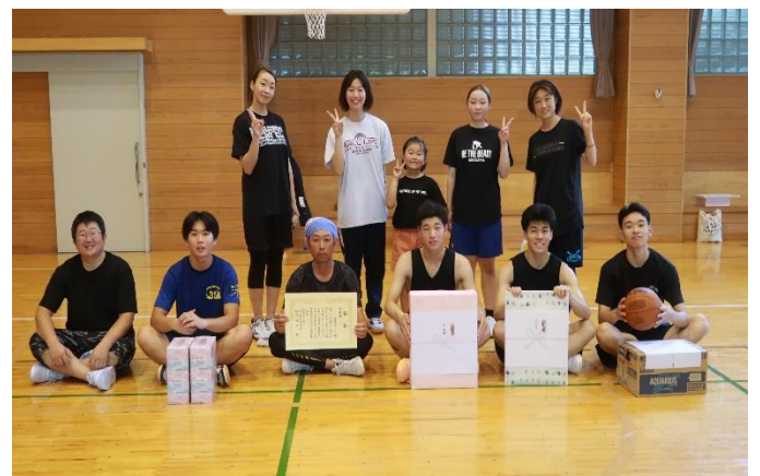
準優勝した岩沢区メンバー