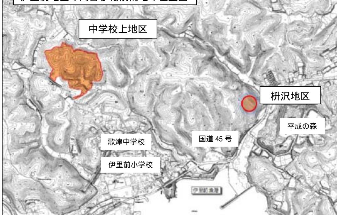
伊里前地区の高台移転候補地の位置図

説明会では、一般の住民のみなさんの意見を取り入れる機会をもっと多く持つことや、高台移転を希望する方々同士の話し合いの場を持つことなどの要望が出されました。今後は、こうした意見を踏まえて、これまで以上に活発な協議会活動に努めてまいりますので、地域住民のみなさんの積極的なご参加とご協力をよろしくお願いいたします。