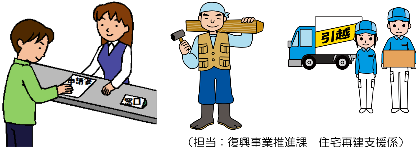
(担当：復興事業推進課 住宅再建支援係)