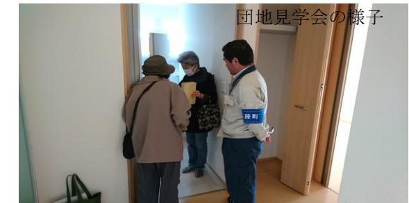
団地見学会の様子