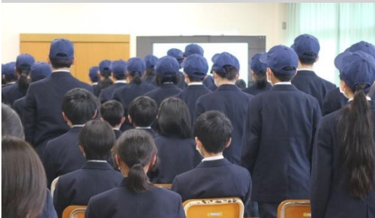
入会式の呼名及び戴帽