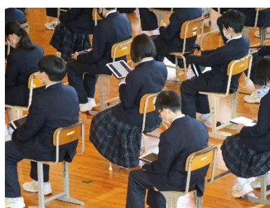
タブレットでの資料確認