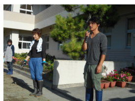
施設部長さんのあいさつ

朝早くからの作業にも関わらず、たくさんみなさんが集まってくれました。大人に交じって、子どもたちもお手伝いに来てくれたのがとてもうれしかったです。