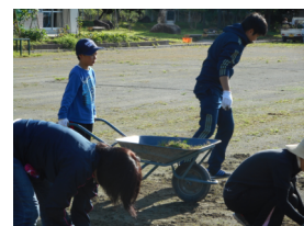
子どもたちも一生懸命お手伝い