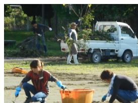
万草箒や軽トラックが活躍