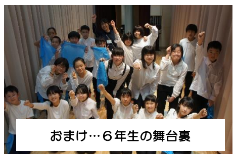
おまけ…6年生の舞台裏