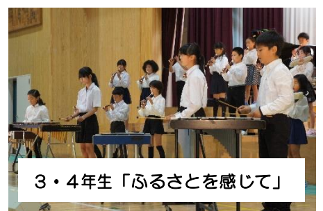
3・4年生「ふるさとを感じて」