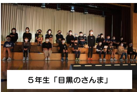
5年生「目黒のさんま」