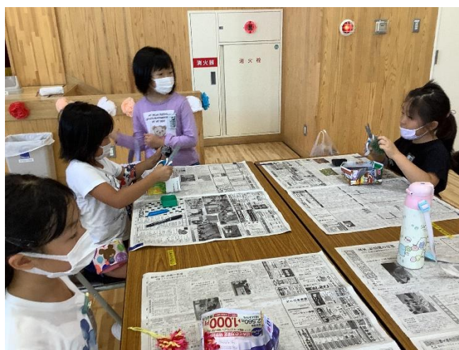
ぽんぽん作りをしています。