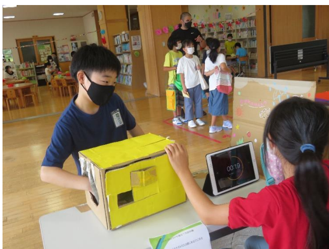
宝探しに挑戦！時間内にいくつ見付けられるかな！？