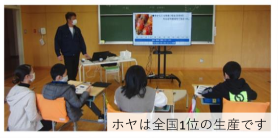
ホヤは全国1位の生産です