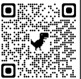
ホームページへのQRコード

体験会「ひこりの里でゲーム企画」「移住と農業後継者問題」「地域の素材を使った料理」「動画・写真コンテンツでPR」などの発表がありました。GTの皆さんから一つ一つ丁寧に良かったところ、改善が必要などところを指摘していただきました。予定では、さらに改善し、12月2日(木)の学習参観日に最終発表となります。御期待ください。