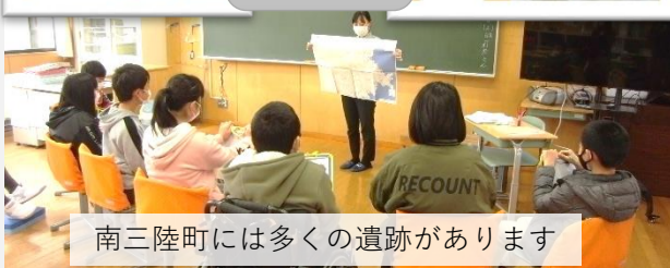
南三陸町には多くの遺跡があります