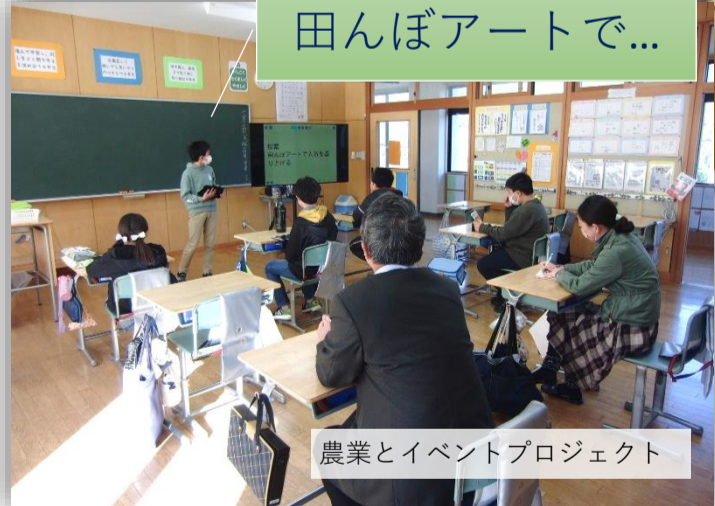
農業とイベントプロジェクト