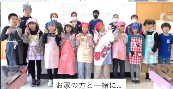
お家の方と一緒に...