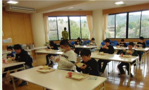
もりもり給食を食べています

11月27日(金)の給食後に6年生が共立女子大学の学生とオンライン授業を行いました。この活動は、共立女子大学が社会地域連携のプロジェクト事業の一環として行っています。家政学部の学生が南三陸町の食材を使用した給食献立を考案し、町内7小中学校へ提供しました。