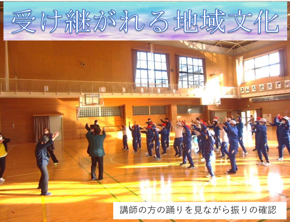
講師の方の踊りを見ながら振りの確認

入谷小学校のコミュニティ・スクールの形が少しずつ形作られています。お、この踊りの伝承は、第一回目の学校運営協議会において目標の一つとなった地域学校協働活動です。