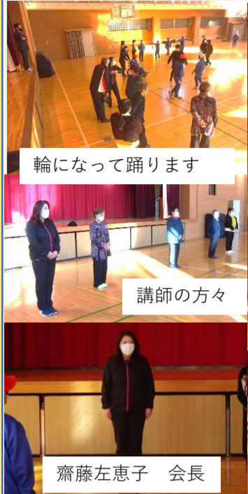
輪になって踊ります