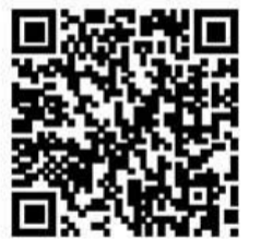
ホームページへのQRコード